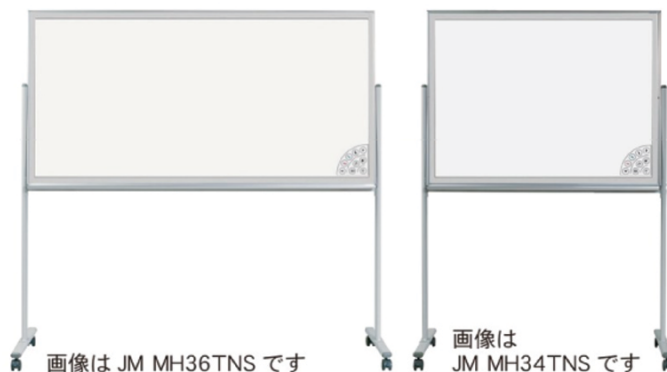
画像は JM MH36TNS です

※タブレット・スマホへのダウンロードはインターネットへの接続と専用アプリが必要です。